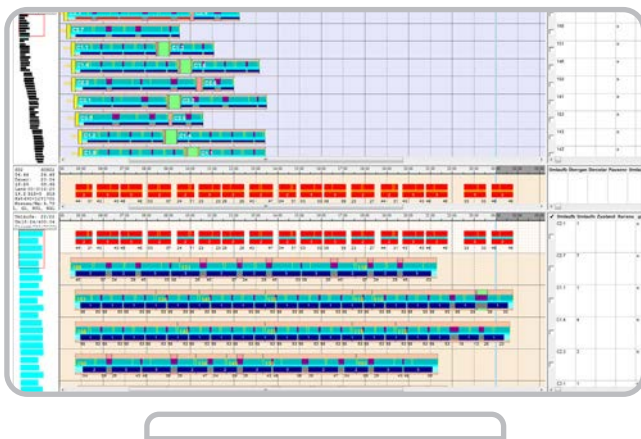
„Schöne Dienste“ mit der IVU.duty Dienstplanung bei der BLT (Ausschnitt)

Im zweiten Schritt stellte die BLT den gesamten Prozess der Dienstplanung auf softwaregestützte Planung mit IVU.duty um. Das ermöglichte, Dienste automatisch zu planen und zugleich zu optimieren. Vertreterinnen und Vertreter der Fahrdienstangestellten definierten darüber hinaus die Erwartungen an einen